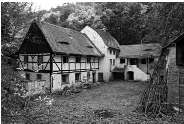
Foto je z doby před rekonstrukcí, v současné době je areál nově opraven.

Zuzana Antošová, tel.: 220 910 314 e-mail: chalupy@a-tom.cz